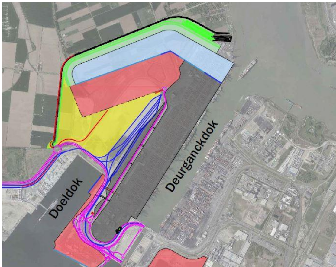
Figuur 2. Kaart met de indicatieve contouren van Tweede Getijdendok en logistieke zone Drie Dokken