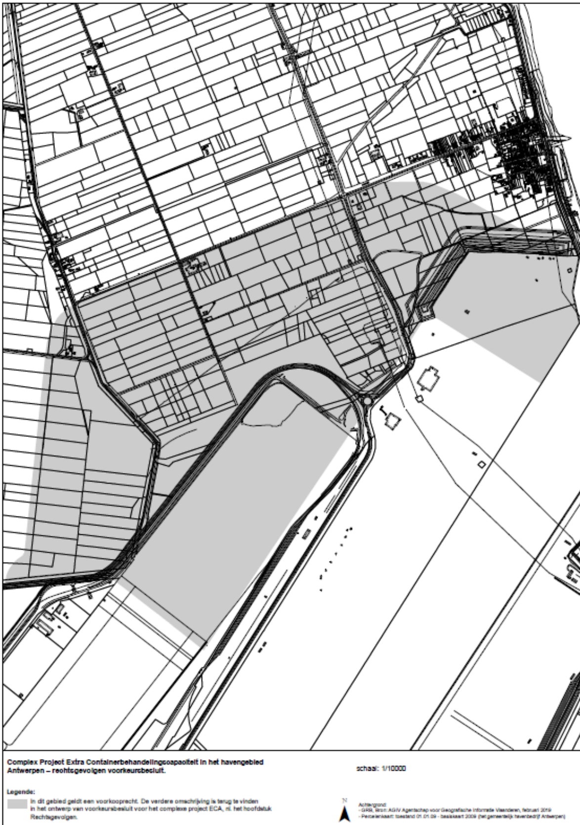
Figuur 6. Kaart met recht van voorkoop