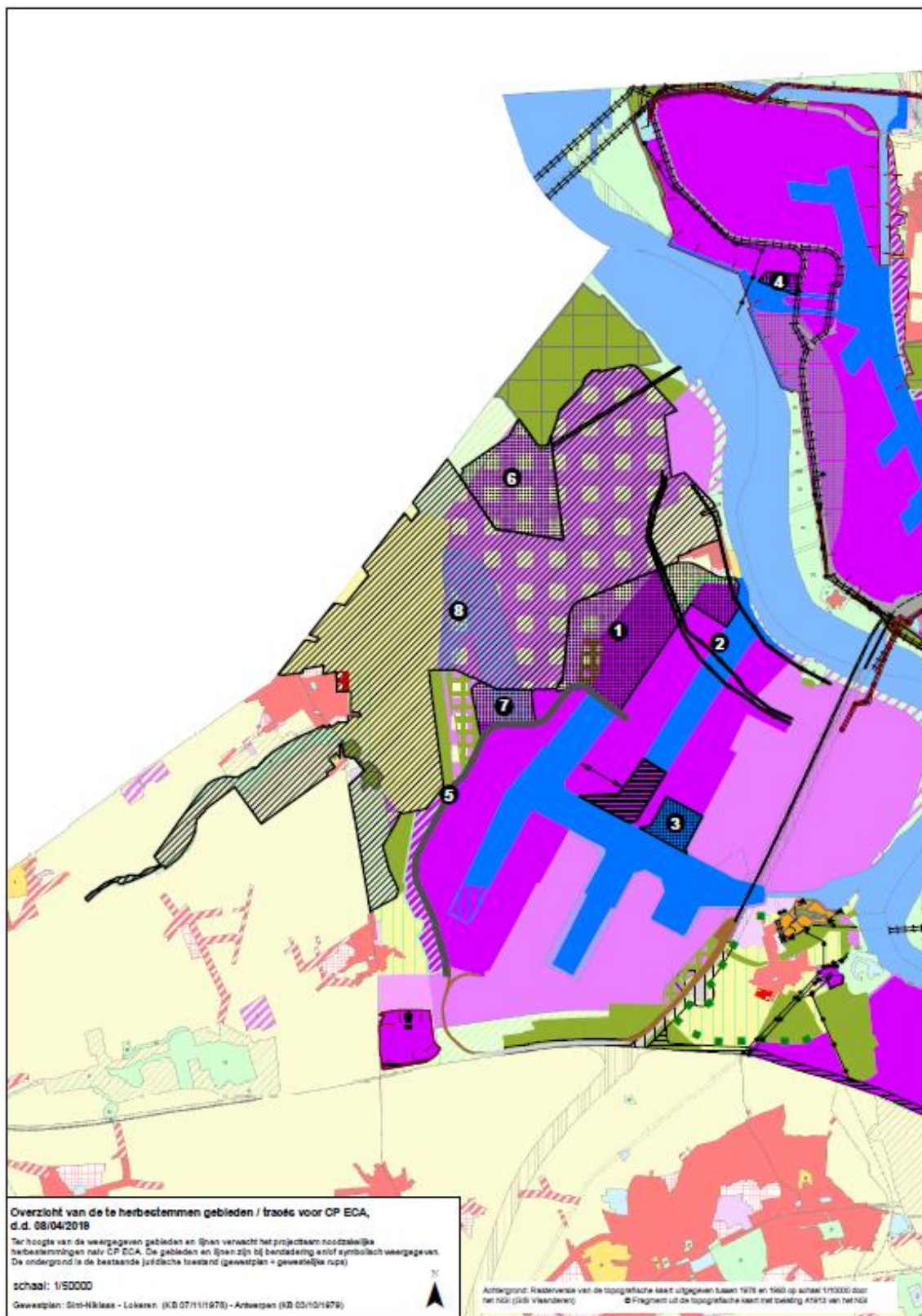
Figuur 4. Kaart met zones waar principieel kan worden afgeweken van bestaande ruimtelijke bestemmingen