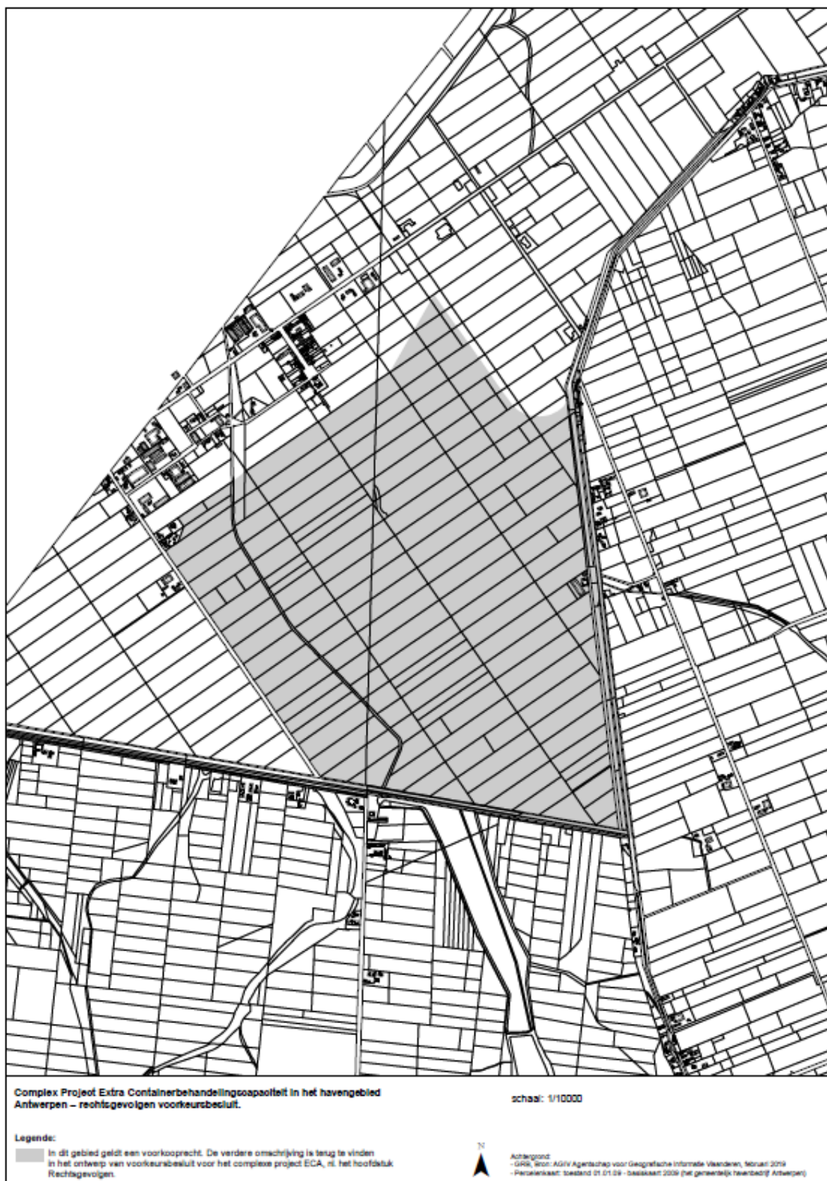
Figuur 7. Kaart met recht van voorkoop