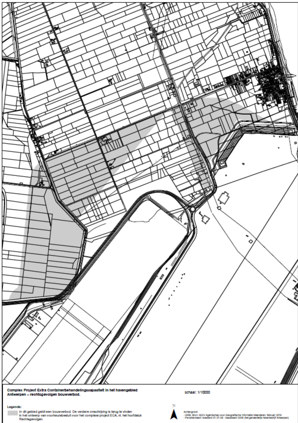
Figuur 5. Kaart met bouwverbod