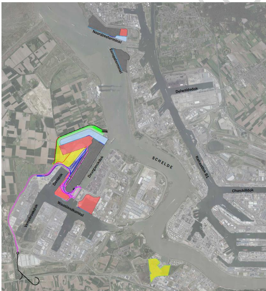
Figuur 1. Alternatief 9 met de bouwstenen voor extra containerbehandelingscapaciteit, industriële/logistiek terreinen en de westelijke ontsluiting

Deze optimalisaties dienen gezocht te worden ten zuiden van de grens weergegeven op bijgevoegd plan (zie Figuur 1 en Figuur 2). Dit neemt niet weg dat de op de kaarten weergegeven contouren met inbegrip van de bedoelde grenslijn indicatief en voorlopig zijn, en dat zij nog aangepast kunnen worden op grond van het verder onderzoek tijdens de uitwerkingsfase, bijvoorbeeld met het oog op het nemen van gepaste en/of noodzakelijke maatregelen, het verplaatsen van leidingen, bouw van een vrachtwagensluis, aanpassen van drainagegrachten e.d.