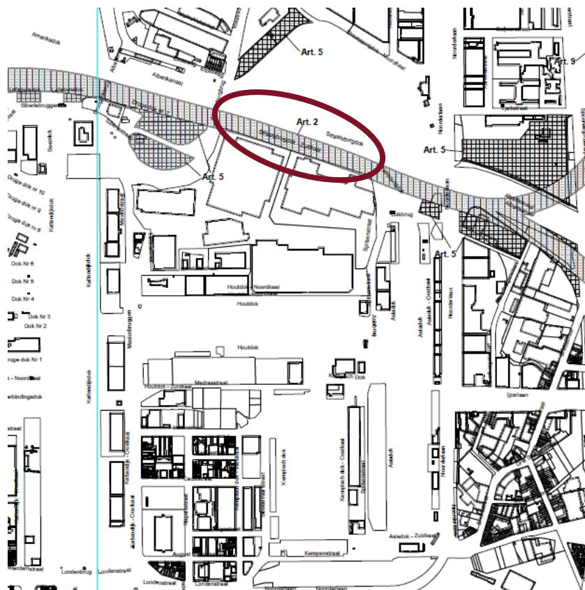
GRUP Oosterweel t.h.v. Mexico-eiland en Steenborgerweert: gedeeltelijke herziening van artikel 2.2

Binnen het gewestelijk RUP 'Oosterweel – wijziging' verbiedt artikel 2.2 van de stedenbouwkundige voorschriften namelijk om in deze zone gebouwen en constructies op te richten andere dan noodzakelijk voor de ongelijkvloerse wegeninfrastructuur, in functie van de ruimtelijke inpassing, ecologische verbindingen, kruisende infrastructuren en leidingen.