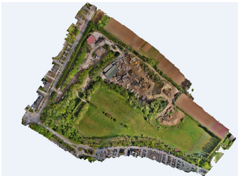
Figuur 1.1 Luchtfoto van de bedrijvigheid en nabije omgeving (cfr. Vanpachtenbeke, z.d.).

te bestendigen en beperkte ontwikkelingsmogelijkheden te bieden door een herbestemming van 'parkgebied' naar 'gebied voor ambachtelijke bedrijfsactiviteiten en KMO'. De gemeente voorziet de planneutraliteit van deze ingreep door de herbestemming van drie kleinere gebieden naar een openruimtebestemming (landbouw, groen).