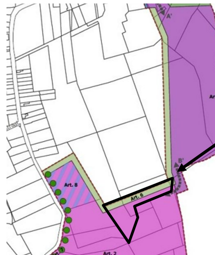
Voorontwerp gemeentelijk RUP 'Staatsbaan'

Wat betreft de vraag tot instemming met de afwijking van de voorschriften van het gewestelijk RUP 'Klei van Ieper en Maldegemklei' kan akkoord gegaan worden met de motivering van de gemeente Kortemark. De gevraagde aanpassing sluit aan op de aanpalende zones en de al gerealiseerde bestemmingen en kadert binnen een ruimere aanleg van de omgeving. Planinhoudelijk en milieutechnisch zijn er geen bezwaren tegen het verzoek van het gemeentebestuur van Kortemark. Door de beperkte oppervlakte (0,4 ha) is de ruimtelijke impact zeer beperkt en niet strijdig met de bepalingen van het Ruimtelijk Structuurplan Vlaanderen. Het planvoornemen heeft geen negatieve impact op de landbouwstructuur in de omgeving. Bijgevolg kan ingestemd worden met het verzoek tot afwijking van het gewestelijk ruimtelijk uitvoeringsplan "Klei van Ieper en Maldegemklei" voor de opmaak van het gemeentelijk RUP 'Staatsbaan'.