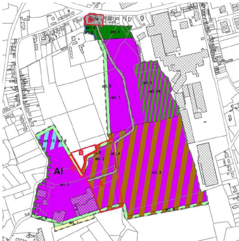
Schematische aanduiding van de zones A-B-C-D uit de startnota gemeentelijk RUP 'Staatsbaan'

Wat de deelzone B betreft, wenst het gemeentelijk ruimtelijk uitvoeringsplan 'Staatsbaan' een beperkte aanpassing van het gewestelijk RUP 'Klei van Ieper en Maldegemklei', dat het plangebied bestemt als 'gebied voor de winning van oppervlaktedelfstoffen - nabestemming agrarisch gebied'. De gemeente stelt voor om de bestemmingsvoorschriften van dit gewestelijk ruimtelijk uitvoeringsplan te wijzigen zodat de grillige begrenzing wordt weggewerkt en er mogelijkheden ontstaan voor het bestaan agro-industrieel bedrijf 'Verduyn NV'.