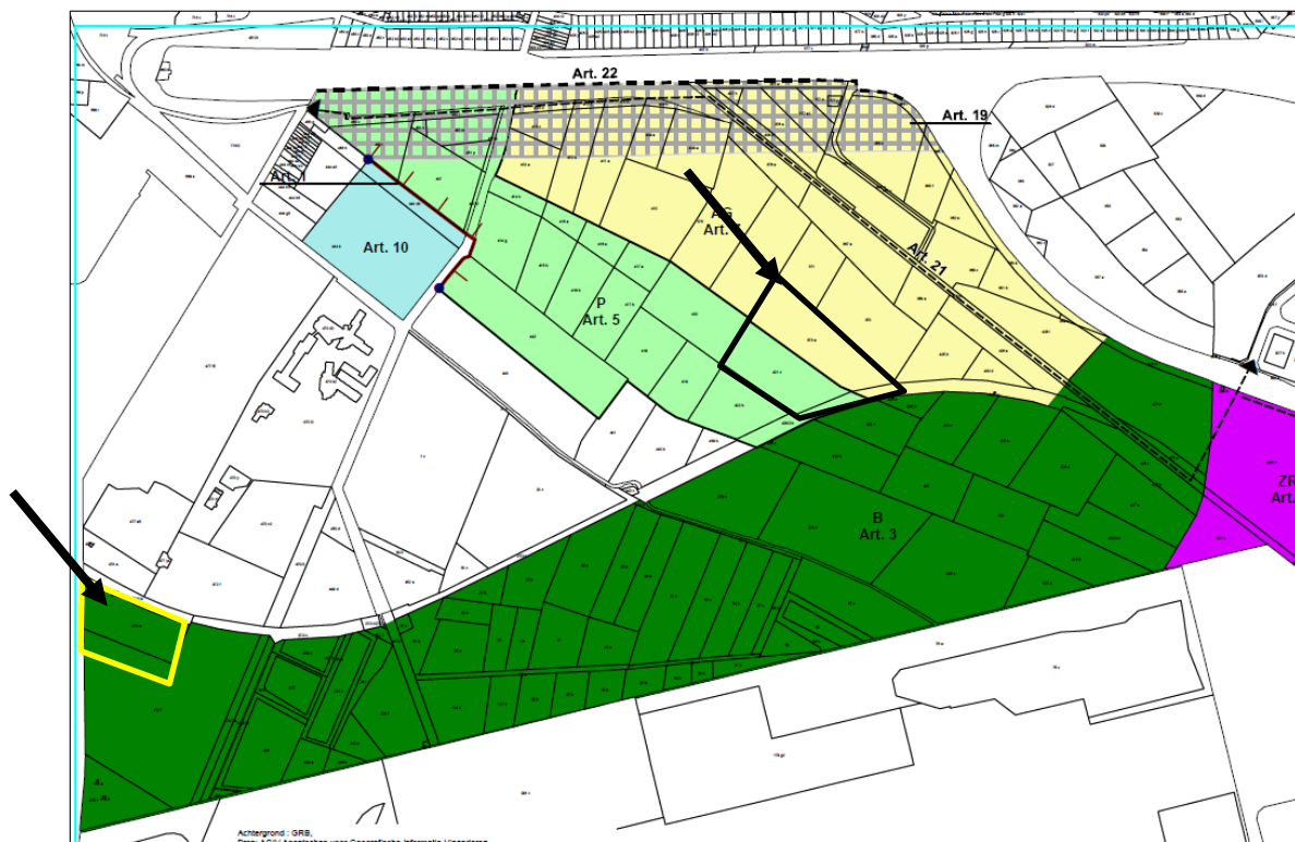
Gewestelijk RUP "Afbakening Zeehavengebied Gent – fase II" (deelplan 2)

Het behoud en de planologische bestemming van het kleiduijschieten legt geen hypotheek op de inrichtingsprincipes van het koppelingsgebied, mede gelet op het feit dat de schietstand is aangegeven op het masterplan van het landinrichtingsproject. De herbestemming van het "bosgebied" van het gewestelijk RUP naar "recreatiegebied" in functie van het behoud van de kleiduijschietstand is aanvaardbaar en niet strijdig met de bepalingen van het Ruimtelijk Structuurplan Vlaanderen of het gemeentelijk ruimtelijk structuurplan.