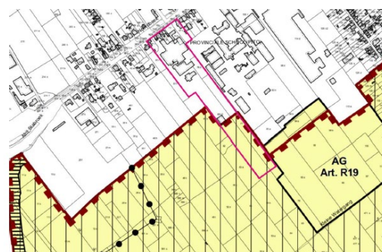
Figuur 62: Mouterij Dingemans - GRUP 'Afbakening zeehavengebied Antwerpen'

De gemeente Stabroek heeft in haar verzoek en toelichtingsnota bij het voorontwerp van gemeentelijk ruimtelijk uitvoeringsplan 'Zonevreemde bedrijven - herziening', zoals voorgelegd aan de plenaire vergadering van 26 juni 2023, gemotiveerd waarom zij bijkomende mogelijkheden wil bieden aan het bedrijf op de huidige locatie.