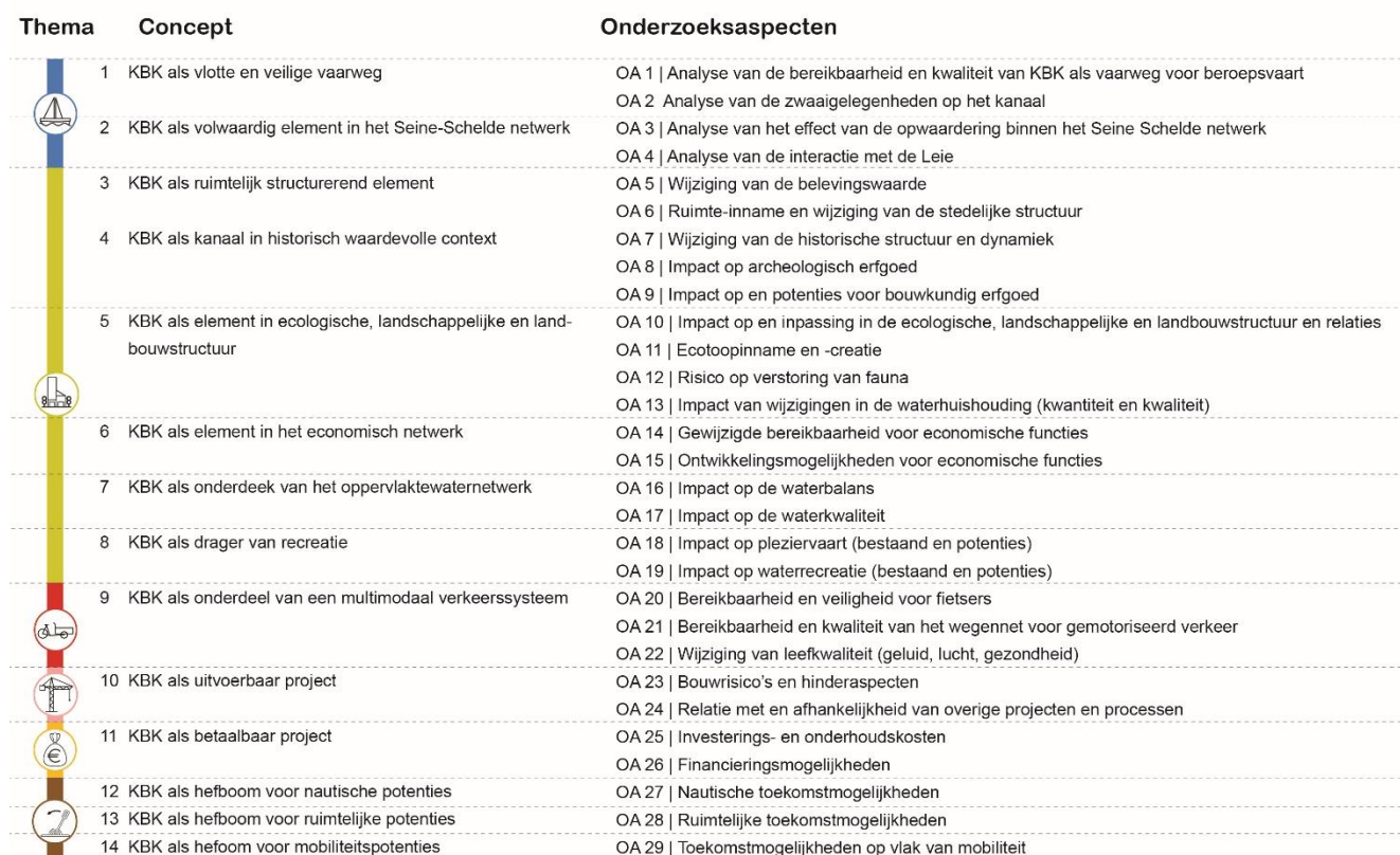
Figuur 3: Overzicht van de onderzoeksaspecten per concept

De ontwerp onderzoeksrapporten en de algemene bijlagen zijn te raadplegen in de bibliotheek op de website.