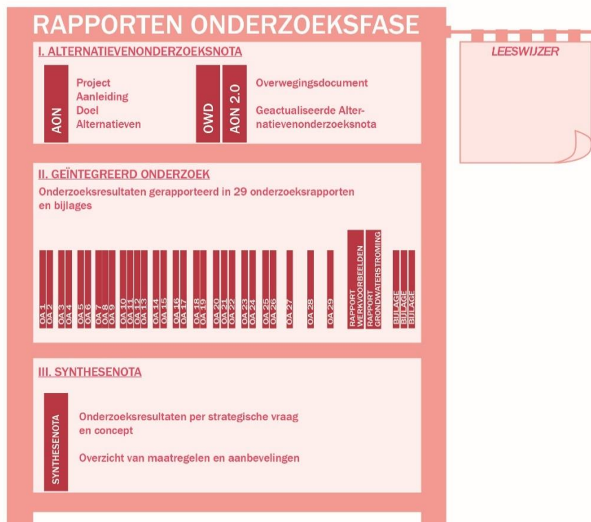
Figuur 1. Weergave rapporten van de onderzoeksfase

Figuur 1 geeft een overzicht van de rapporten die in het kader van de onderzoeksfase werden opgesteld en die momenteel beschikbaar zijn. Zowel voor het geïntegreerd onderzoek als de synthesesnota betreft het steeds ontwerp rapporten .