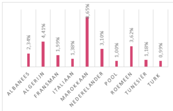
Grafiek 1: De tien meest voorkomende nationaliteiten naast Belg in de Belgische gevangenissen in 2019