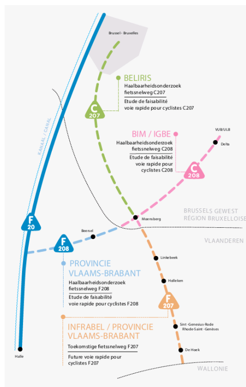
Figuur Fout! Geen tekst met de opgegeven stijl in het document.-2: Situering onderzoeken fietssnelwegen in de regio