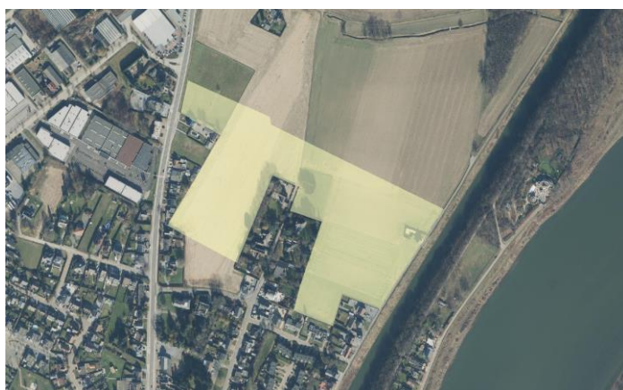
Deelplan 2 'Ter Hocht' waar een bestemmingswijziging van woonreservegebied naar bouwrijp agrarisch gebied is voorzien