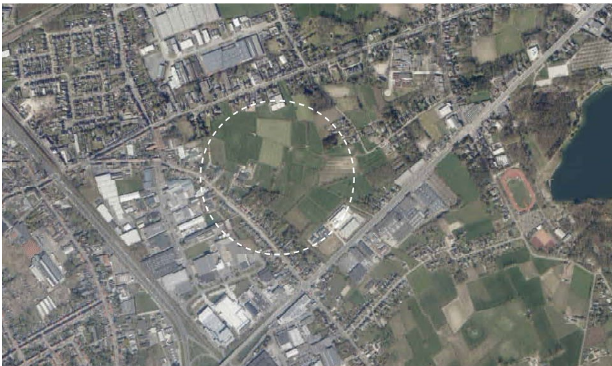
Situering van het plangebied RUP "De Raap"

door woonlinten. Een netwerk van noord-zuid georiënteerde beekjes en grachten dooradert het gebied. Binnen deze open zone bevinden zich een landbouwbedrijf en een gemengd bos (ca 0,75 ha).