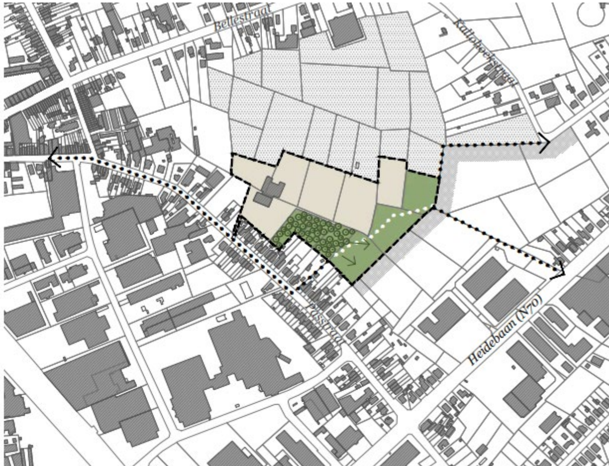
Gemeentelijk RUP “De Raap” (scopingnota) – gewenste structuur

Het doel van het gemeentelijke RUP “De Raap” is om een deel van het bestemde woongebied te herbestemmen naar bosgebied voor de realisatie van een buurtbos in afwachting van de ontwikkeling van het omliggende woongebied. De drie percelen (ca. 1,5 ha) in het oosten van het plangebied zijn reeds verworven door de stad Sint-Niklaas met het oog op de bosuitbreiding. Hierbij werd de pachtovereenkomst met de landbouwer (einddatum december 2027) overgenomen door de stad. Het andere deel (ca 3,3 ha) behoudt zijn huidige bestemming maar krijgt een nabestemming ‘zone voor bos’. Op die manier kunnen de landbouwactiviteiten verdergezet worden tot de eigenaar-landbouwer beslist zijn activiteiten stop te zetten. Er wordt geen onteigeningsplan gekoppeld aan het RUP.