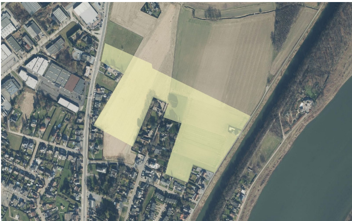
Deelplan 2 'Ter Hocht' waar een bestemmingswijziging van woonreservegebied naar bouwvrij agrarisch gebied is voorzien