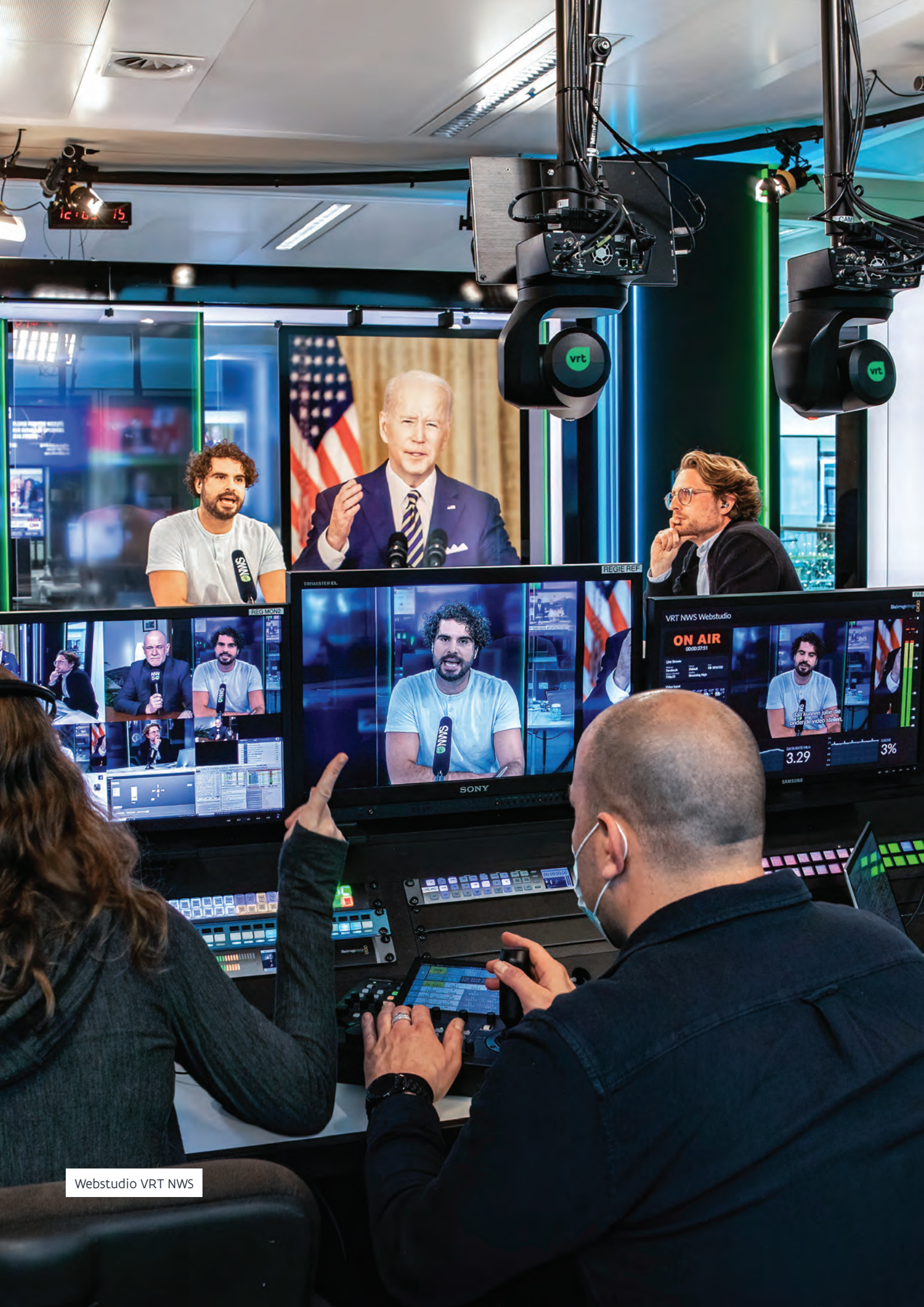
Webstudio VRT NWS