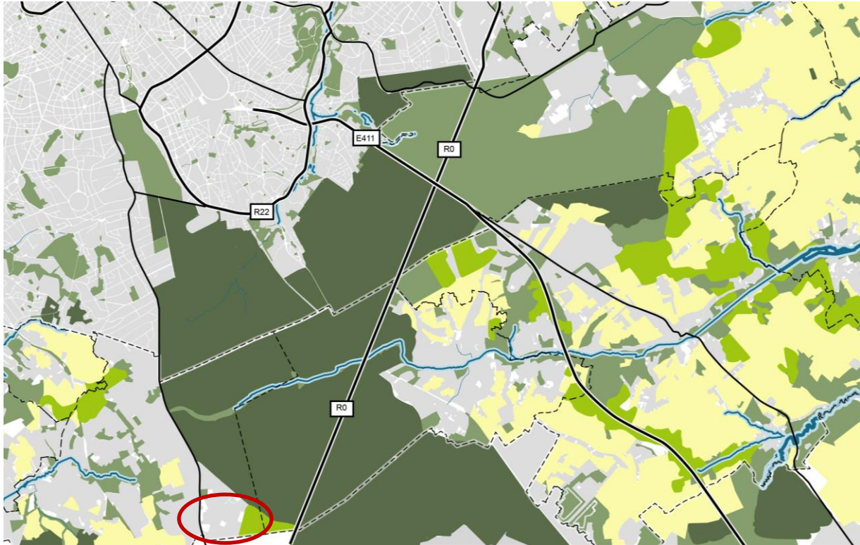
Structuurschets bosversterking en bosverbinding omgeving Zoniënwood met aanduiding zoekzone Groenendaal (rood) uit de startnota (eigen figuur)