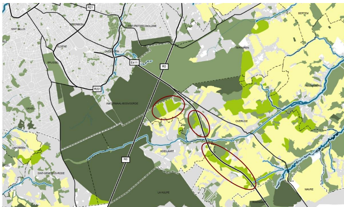
Structuurschets bosversterking en bosverbindingen omgeving Zoniënwoud met zoekzones Jezus-Eik (eigen figuur)

In functie van de versterking van de bosstructuur zijn nabij Jezus-Eik zijn verschillende zoekzones aangeduid die in aanmerking komen voor opname in het GRUP in functie van een herbestemming naar bosgebied. Daarbij is rekening gehouden met inzichten vanuit de projecten Horizon+ en Brabantse Wouden (zie hoofdstuk 2.5). Het gaat om het gebied aan Welriekende Dreef, aansluitend aan het Zoniënwoud en de zones langsheen de brede berm van E411 tot aan Maleizen. Binnen deze zoekzones zullen in een volgende fase concrete gebieden geselecteerd worden die als bosgebied opgenomen worden in het GRUP. Binnen dit bosgebied zal ook worden onderzocht welke functies compatibel zijn met de bosbestemming en meegenomen worden als nevenschikte functies.