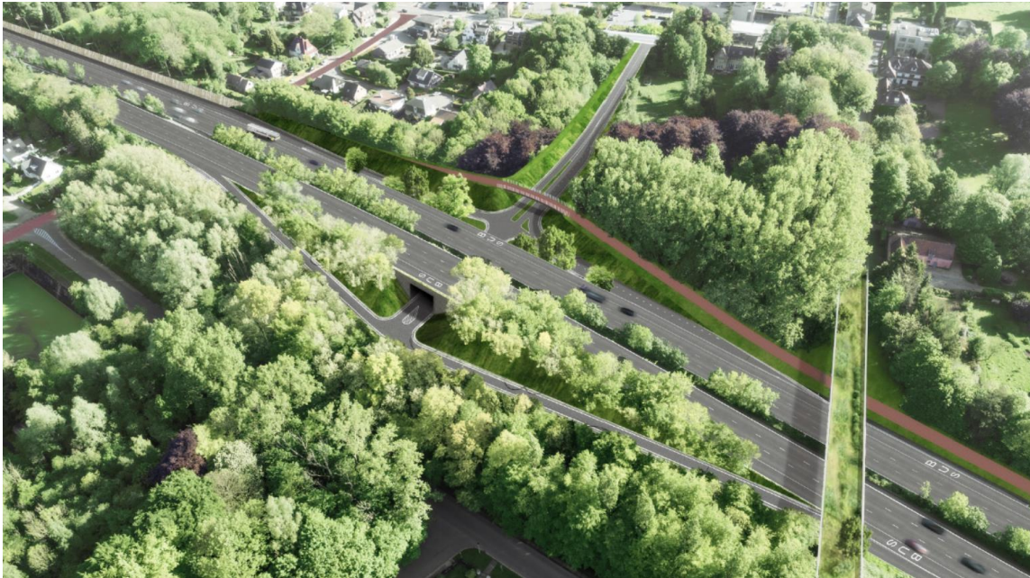
Ideeschets voor één van de mogelijke oplossingen voor Jezus-Eik oost uit het Projectboek R0 Oost

In de startnota wordt aangegeven welke locaties- en inrichtingsalternatieven er bijkomend onderzocht worden.