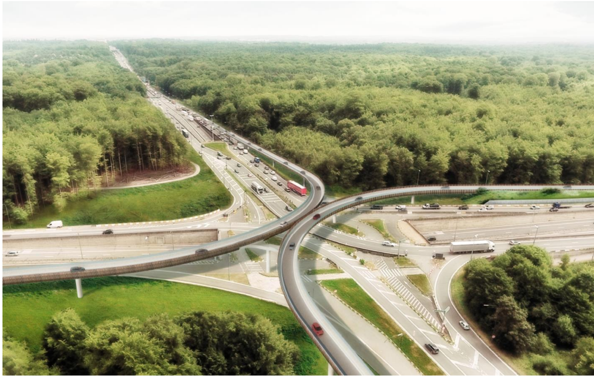
Ideeschets basisalternatief Leonard voor de korte termijn (quick-win) uit het Projectboek R0 Oost