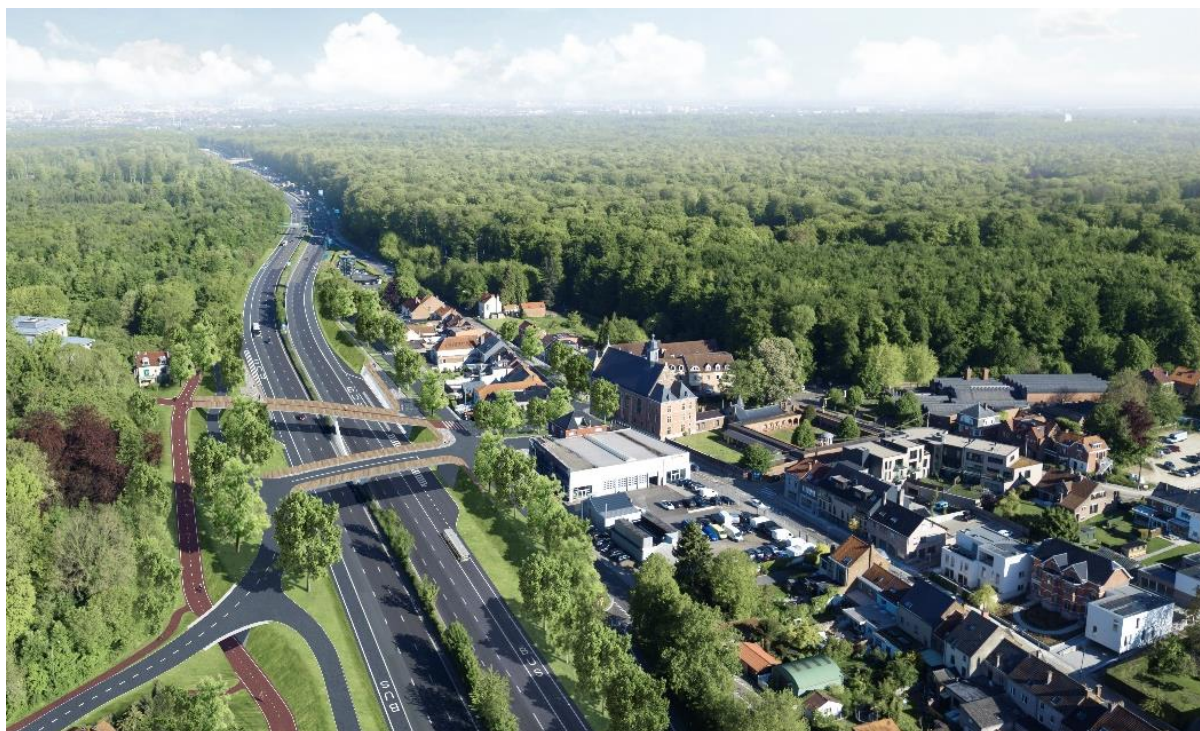
Ideeschets voor één van de mogelijke oplossingen voor Jezus-Eik uit de startnota (eigen figuur - actualisatie figuur Projectboek RO Oost )

De grote transformatie vindt daarom plaats wanneer de huidige op- en afrit Jezus-Eik herschikt of verplaatst wordt en een randparking wordt aangelegd. Voor de concrete ligging en organisatie van het knooppunt Jezus-Eik zijn verschillende alternatieven mogelijk, die worden meegenomen in het verder onderzoek.