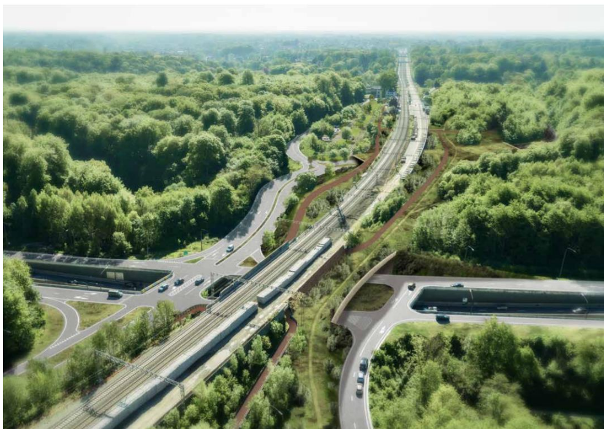
Ideeschets voorkeursalternatief Groenendaal uit het Projectboek R0 Oost

De geplande werken aan de stationsomgeving van Groenendaal worden geïntegreerd in het voorgestelde ontwerp.