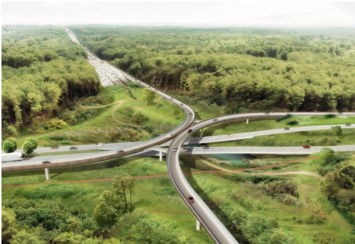
Ideeschets basisalternatief Leonard voor de lange termijn uit het Projectboek R0 Oost