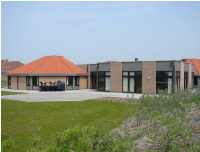
Foto speelplein - behoort niet tot de concessie, maar is vrij toegankelijk – eigendom Stad Oostende