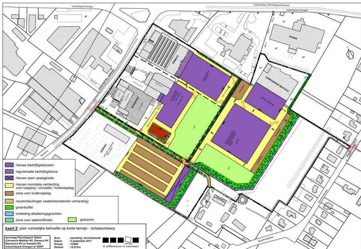
Schets van de uitbreidingsplannen zoals opgenomen als lange termijn behoefte van het planologisch attest

Op 17 juli 2019 leverde de minister bevoegd voor Omgeving een voorwaardelijk gunstig planologisch attest af voor de uitbreidingsbehoeften van de bedrijven Carrosserie Matthys NV, FUNICO NV, Nuscience Belgium NV en Willemen Infra NV.