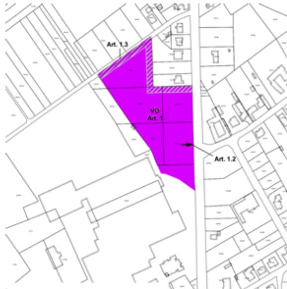
Figuur links: deelgebied 11 van het GRUP 'Gebieden voor oppervlakedelfstoffenwinning Oppervlakedelfstoffenzone 'Leem in Zuid-Limburg''