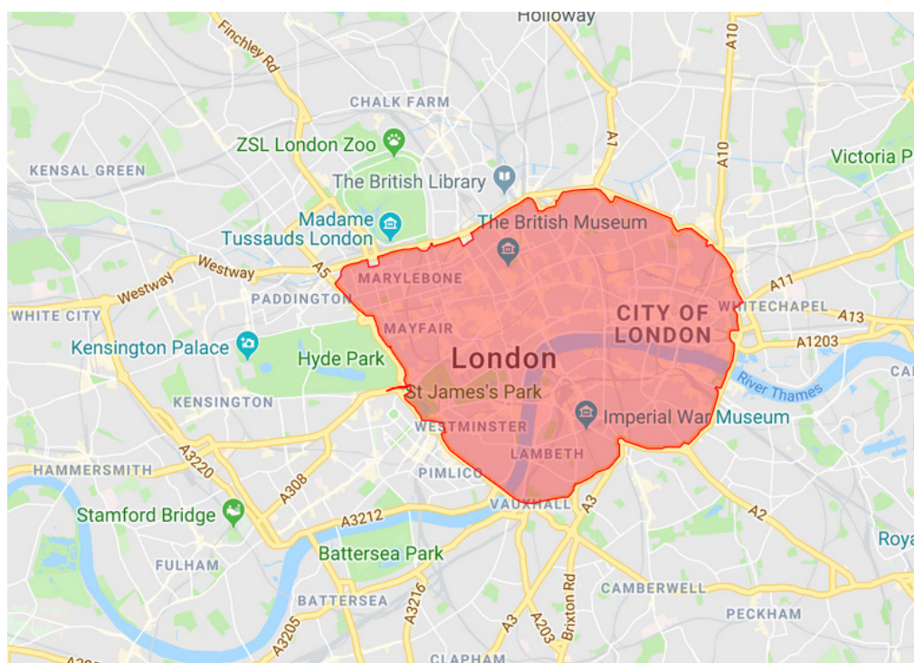
Figuur 1 'Congestion charging zone' Londen

Congestion Charge in Londen: sinds 17 februari 2003 wordt tol geheven binnen de 'charging zone'. Op 19 februari 2007 werd dit gebied uitgebreid met een deel van West Londen (zie figuur voor de huidige 'charging zone'). Doel van de 'congestion charge' is het terugdringen van het privégebruik van personenauto's en het stimuleren van (en investeren in) openbaar vervoer. Bij het binnenrijden van de zone is een betaling van £11,50 vereist voor elke werkdag dat men het gebied tussen 7 uur 's ochtends en 18 uur 's avonds inrijdt met een betalingsplichtig voertuig.