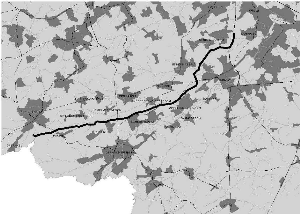
Figuur 1. Situering tracé aardgasleiding Brakel-Haaltert

Het tracé is gesitueerd in het zuiden van de provincie Oost-Vlaanderen, en doorkruist de gemeenten (van west naar oost): Brakel, Lierde, Geraardsbergen, Ninove, Denderleeuw en Haaltert.