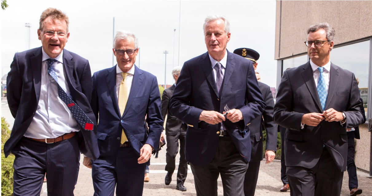
Brexit-onderhandelaar voor de EU, Michel Barnier, bezoekt de Haven van Zeebrugge op 22 september 2017 samen met Federaal Minister van Financien Van Overveldt, Vlaams Minister-president Bourgeois en Bestuurder van Haven van Zeebrugge, Jaachim Coens.

Om dit te realiseren werden zowel in het hoofdbestuur in Brussel, de Algemene Afvaardiging van de Vlaamse Regering bij de EU als in de Algemene Afvaardiging van de Vlaamse Regering in het Verenigd Koninkrijk tijdelijk experts in dienst genomen. Indien het terugtrekkingsakkoord gerealiseerd wordt zal gedurende de transitiefase nood zijn aan een nauwe opvolging van de onderhandelingen over een toekomstig samenwerkingsakkoord. Indien we afstevenen op een no-deal zal eveneens nood zijn aan expertise. Om deze redenen wordt de tewerkstelling van de brexitexperts verlengd.