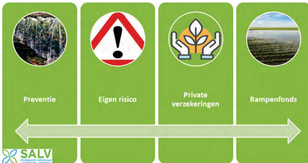
Figuur 1 Het Rampenfonds vormt een onontbeerlijk component binnen een evenwichtig risicobeheer

de toepassing gebaseerd wordt op evenwichtige drempels inzake verantwoordelijkheid en blootstelling. 11