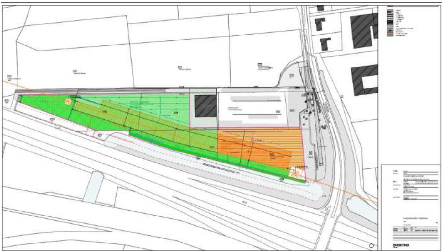
Figuur 2 – ruimtelijke behoeften korte en lange termijn overeenkomstig planologisch attest

Het plan zal het planologisch kader bieden voor de ruimtevragen op korte en lange termijn zoals vooropgesteld in het planologisch attest. Daarbij zal rekening moeten gehouden worden met de randvoorwaarden uit het planologisch attest.