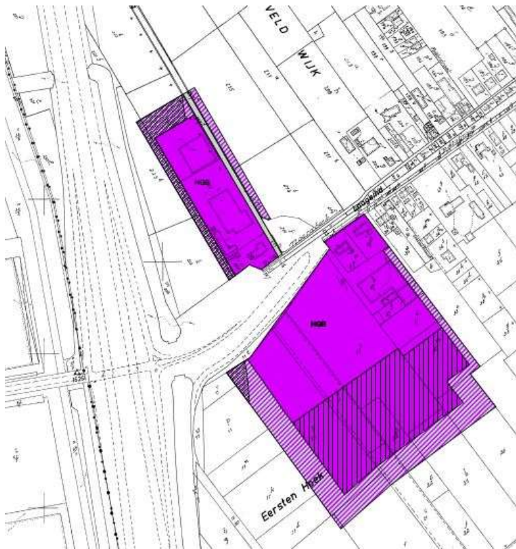
Figuur 2 – Gewestelijk RUP Hoogspanningslijn Zandvliet-Lillo-Liefkenshoek