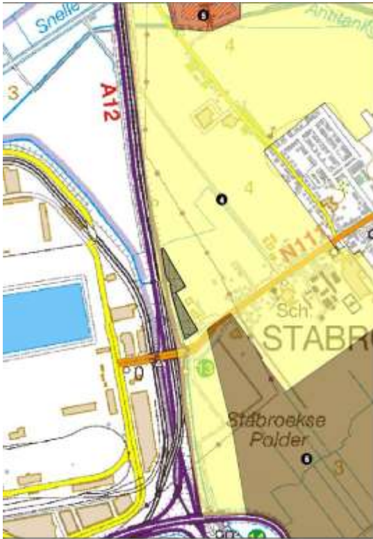
Figuur 4 – uitsnede operationeel uitvoeringsprogramma buitengebiedproces Antwerpse Gordel – Klein Brabant

De Vlaamse Regering nam kennis van de ruimtelijke visie en keurde de beleidsmatige herbevestiging van de bestaande gewestplannen voor ca. 9700 ha agrarisch gebied en een operationeel uitvoeringsprogramma goed voor het buitengebiedproces Antwerpse Gordel en Klein-Brabant (BVR 27/03/09).