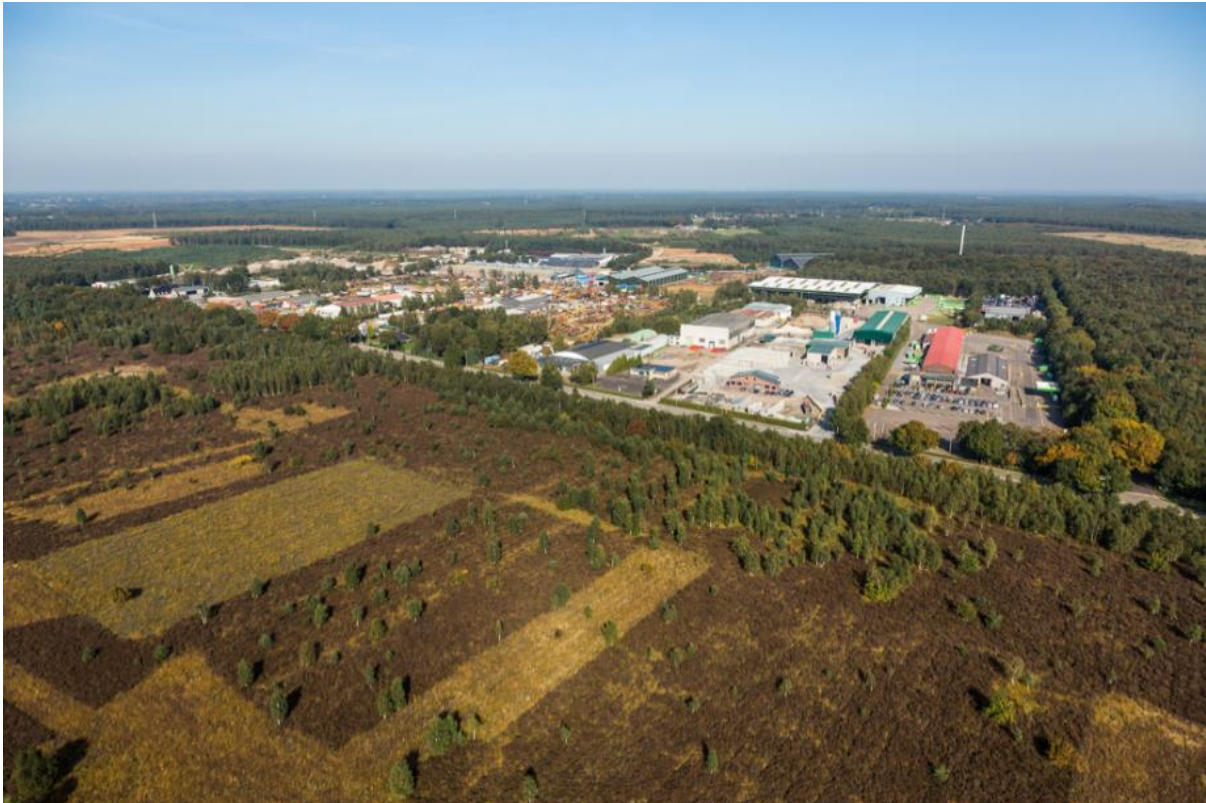
Luchtfoto industrieterrein Op de Berg