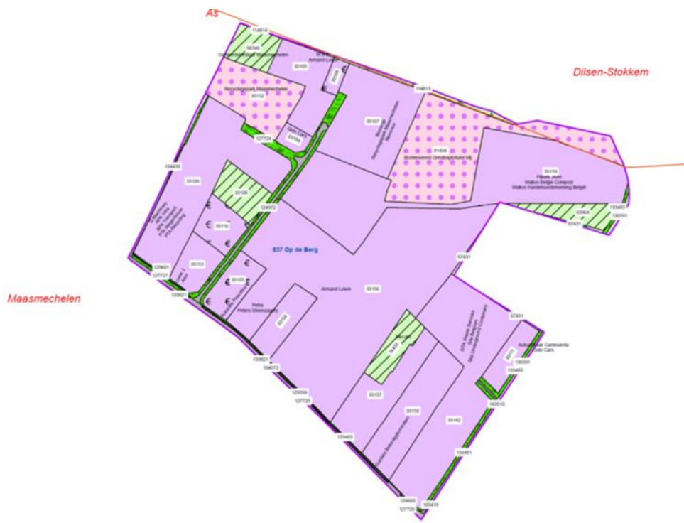
Figuur: Overzicht van de percelering op het industrieterrein

In de omgeving van het industrieterrein wordt de bestemming en het landgebruik grotendeels bepaald door natuur en ontginningen. In 2006 werden, via het GRUP “Berggrindontginning Kempens Plateau”, de ontginningsgebieden uitgebreid. Ter compensatie van de nieuwe grindwinningsgebieden werden de laatste landbouwbestemmingen herbestemd naar natuurgebied. Alle gebieden rond het industrieterrein Op de Berg hebben (na)bestemming natuur.